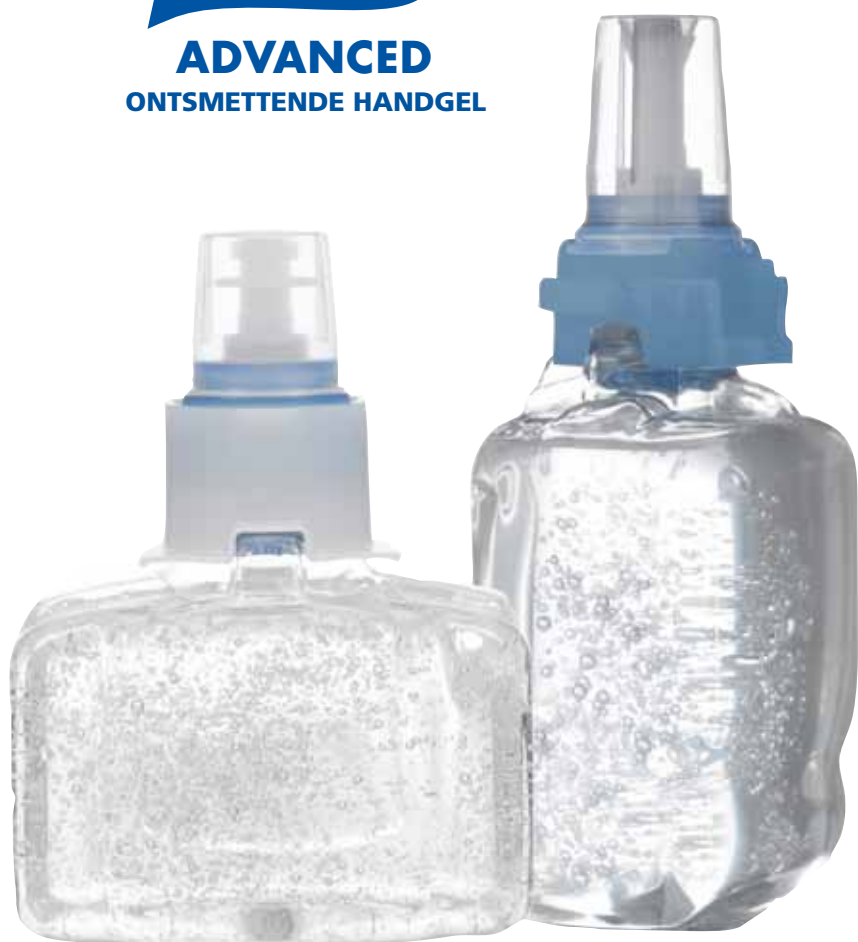
PURELL Advanced Ontsmettende Handgel 1303-03-EEU00