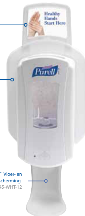
SHIELD ™ Vloer- en wandbescherming 1045-WHT-12