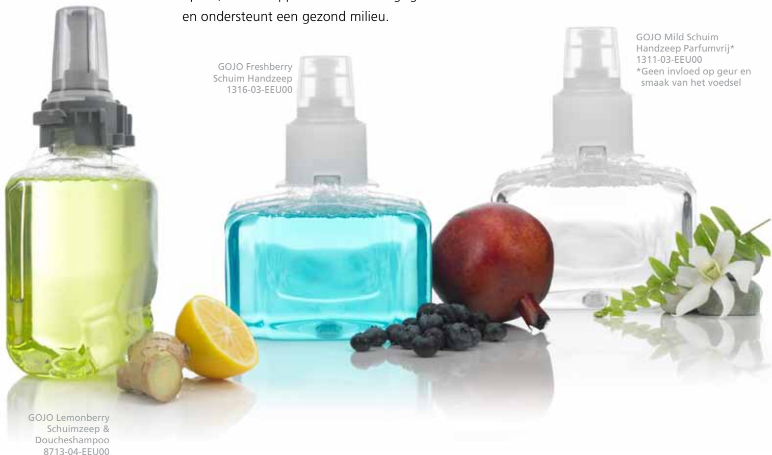
GOJO Lemonberry Schuimzeep & Doucheshampoo 8713-04-EEU00